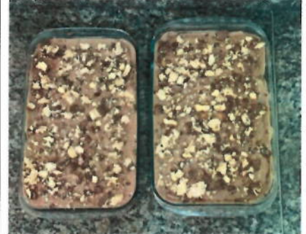
Sobremesa Especial Dia dos Pais