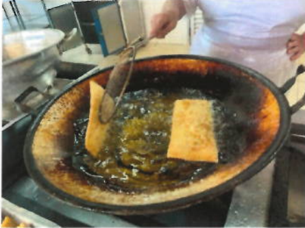
Lanche da Tarde Especial Dia dos Pais com Entrega de Presentes