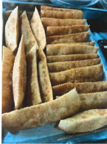
Lanche da Tarde Especial Dia dos Pais com Entrega de Presentes