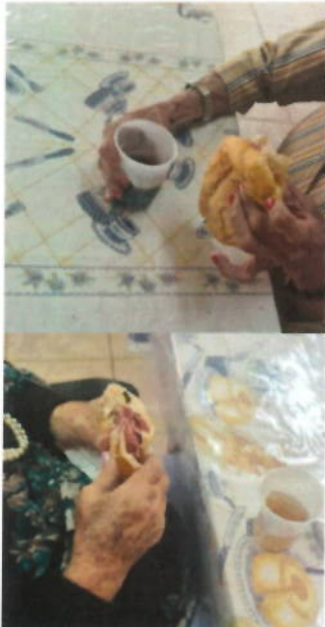
Lanche da Tarde – Doação de Pão com Mortadela e Refrigerantes