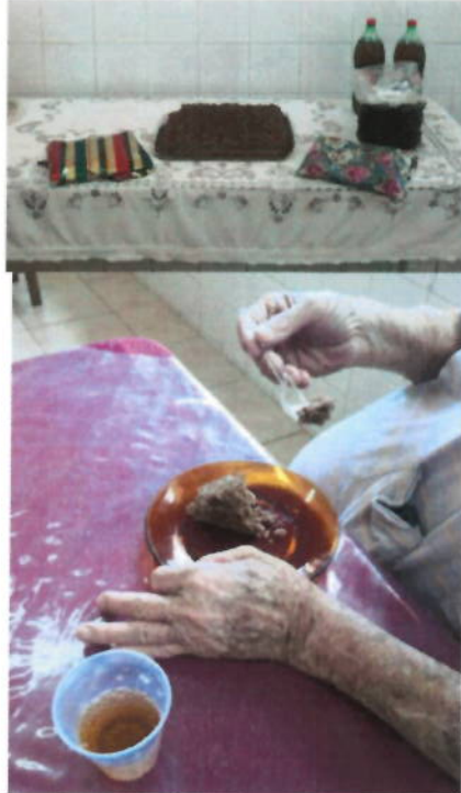
Lanche da Tarde – Bolo dos Aniversariantes do Mês