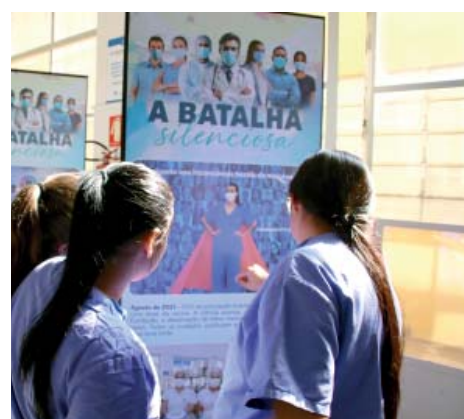
A exposição vai percorrer todas as Unidades