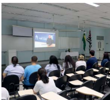
Unifipa - Campus São Francisco