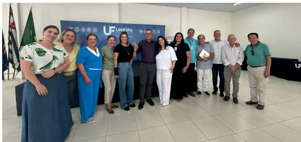
Entrega das chaves