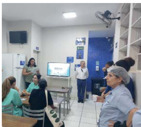
Hospital Padre Albino