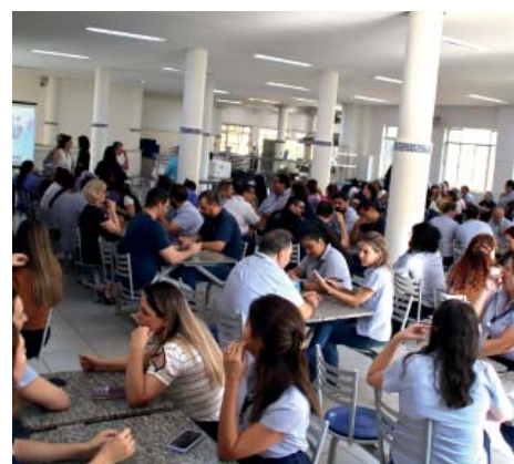
HEC, CSC e Unifipa