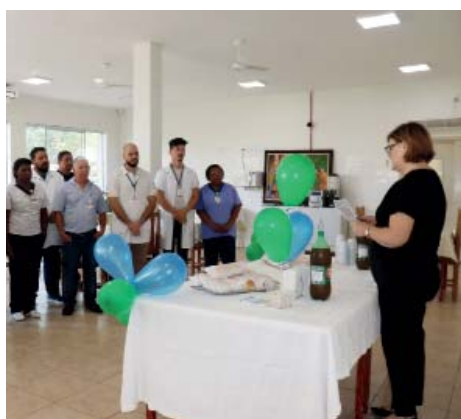
Recanto Monsenhor Albino